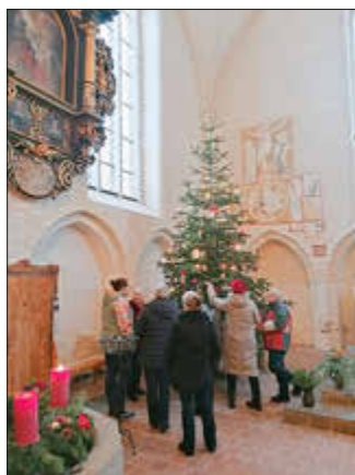
Tannenbaumabsingen am 07.01.2024