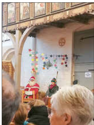
Weihnachtsmann zu Besuch beim Krippenspiel