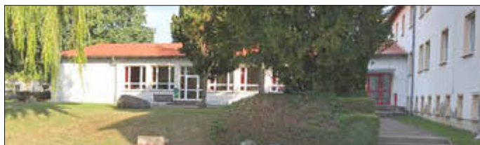
Schulgebäude mit angrenzendem Wohnheim des Velgaster Fachgymnasium in der Neubaustraße 7