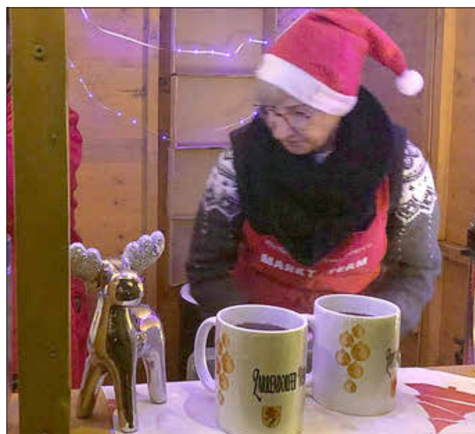
Zarrendorfer Weihnachtsmarkttassen am Glühweinstand

Hallo liebe Zarrendorfer, habt ihr auch unseren 2. Zarrendorfer Weihnachtsmarkt besucht? Danke für die Geduld bei unseren „Anlaufschwierigkeiten“. Wir lernen jedes Jahr dazu, und im nächsten Jahr haben wir bestimmt auch das Problem der Stromversorgung im Griff.