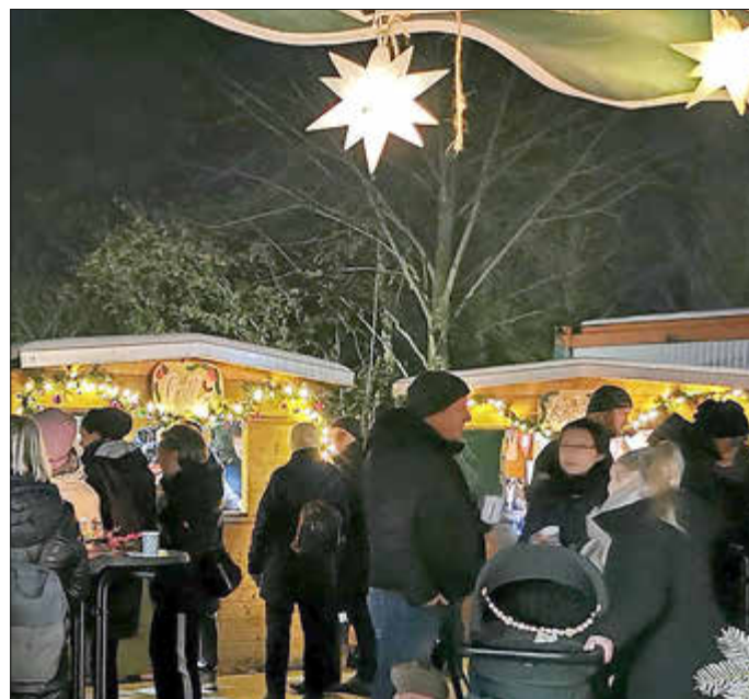
Trubel auf dem Weihnachtsmarkt