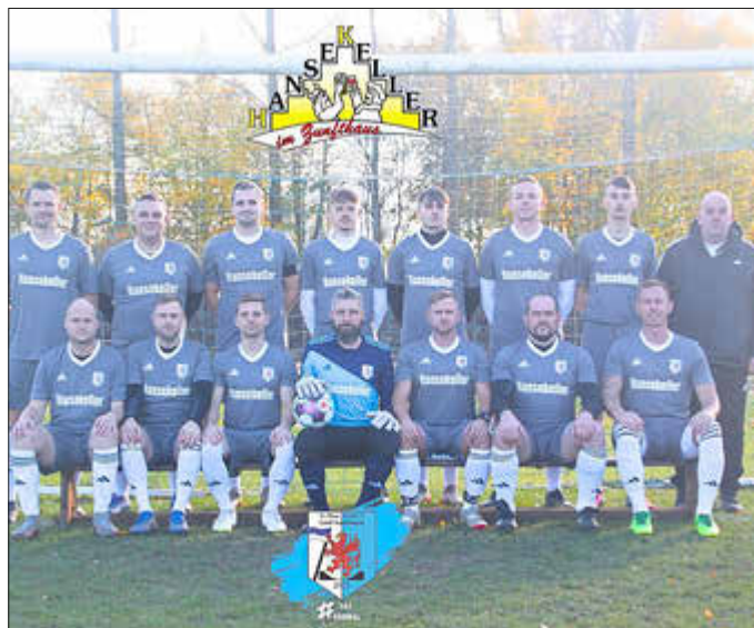
Neue Auswärtstrikots für die Herren von Hansekeller Stralsund