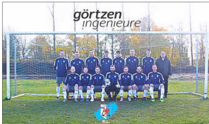
Sweatshirts für die Herren von Görtzen Ingenieure