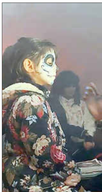
Halloween Party in Groß Kordshagen

Am 30.10.2023 fand am Sportplatz der Blau-Weißen eine Party der Extra-Klasse statt. Es war Zeit für ein bisschen Gruseln und ein bisschen Horror. Gesagt, getan. Mit vielen engagierten Helfern und ganz viel Liebe zum Detail wurden aus den bekannten Räumlichkeiten des Vereines und dem großen Partyzelt ein Horrorkabinett. Jedermann war herzlich zu diesem Event eingeladen und es wurde sehr gut angenommen. Die zahlreichen Kids kamen mit ihren Eltern auf ihre Kosten. Neben einem großen Gruselkabinett, wurde auch noch Kinderschminken und Kinderdisco mit reichlich Tanz und Spiel angeboten. Auch das Catering wurde mit sehr viel Liebe zum Thema angerichtet.