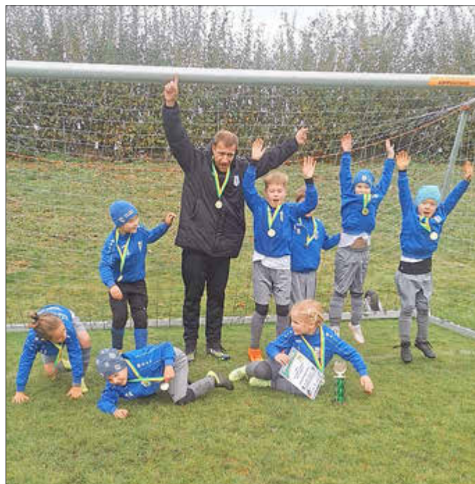
F-Jugend Platz 3 Holz Müller Cup 2023

Unsere F-Junioren wurden am 28.10.2023 vom SV Prohner Wiek zum Holz Müller Cup 2023 eingeladen. Neben dem Gastgeber vom SV Prohner Wiek waren unter anderem SG Empor Richtenberg(I und II), SV Putbus, PSV Stralsund, SV Traktor Kirchdorf und SV 93 Niepars vertreten. Bei so vielen Mannschaften sollte es ein schönes Fußballspektakel werden.