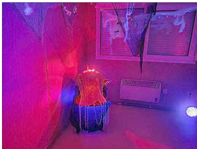
Dekoration Halloween Party in Groß Kordshagen