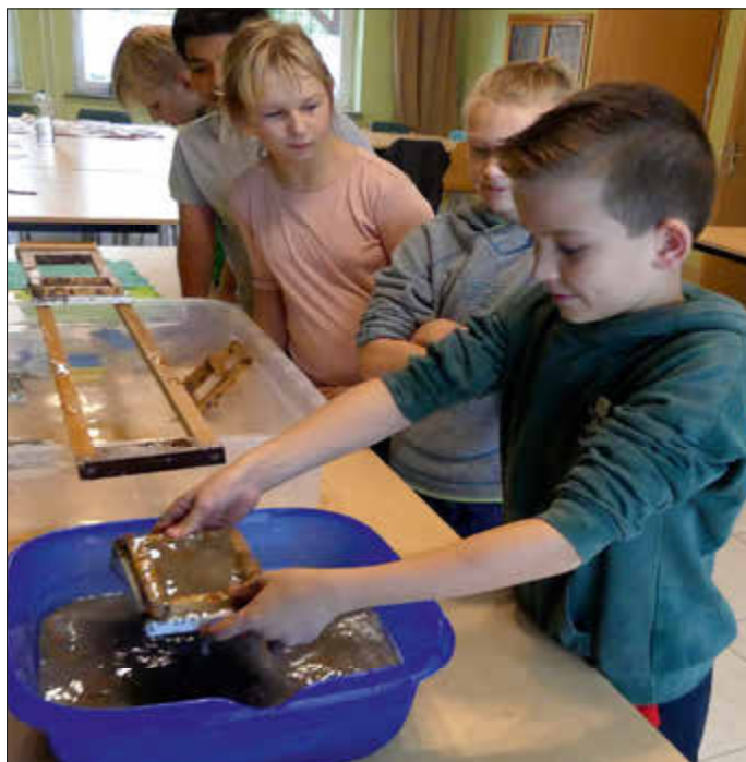
Klasse 4 beim Schöpfen

Unsere 2. Klasse veranstaltete ihr Drachenfest auf unserem großen Sportplatz. Dank des guten Windes fanden fast alle Drachen ihren Weg an den blauen Himmel. Für unsere interessanten Umweltprojekte hatten wir am Mittwoch und Freitag tolle Unterstützung von Mitarbeitern der Abfallwirtschaft des Landkreises und so übten die 2. Klassen das richtige Trennen von Verpackungen. Die Schüler/innen der 3. Klassen bastelten mit Abfällen ihre Fledermäuse. Ganz emsig zeigten sich dann am Freitag unsere 4. Klassen, als sie ihr eigenes Papier herstellten durften und anschließend gestalteten.