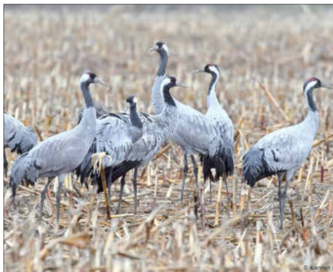
Herbst am Kranorama