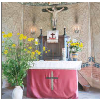
Altar Kapelle Wolfshagen