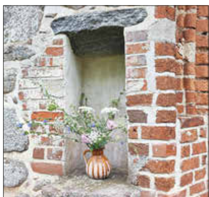
Blumendeko Kapelle Wolfshagen