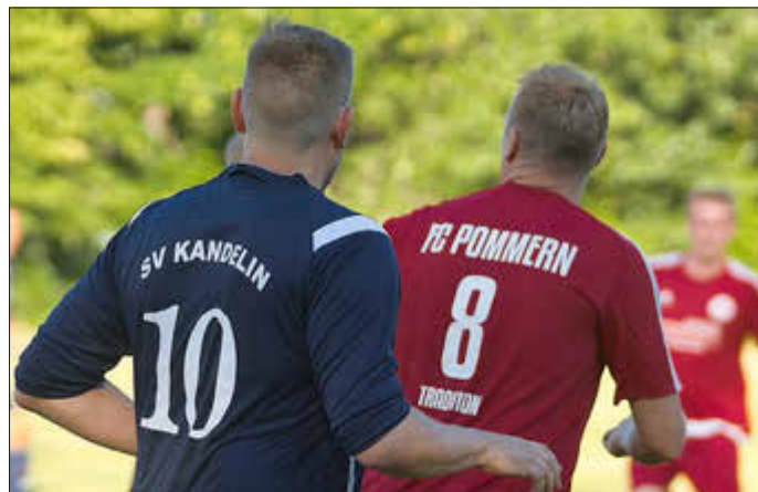
Meisterschaftsfinale Alte Herren auf dem Sportplatz in Groß Kordshagen

Wir hoffen, dass es allen Zuschauern bei uns auf dem Sportplatz gefallen hat.