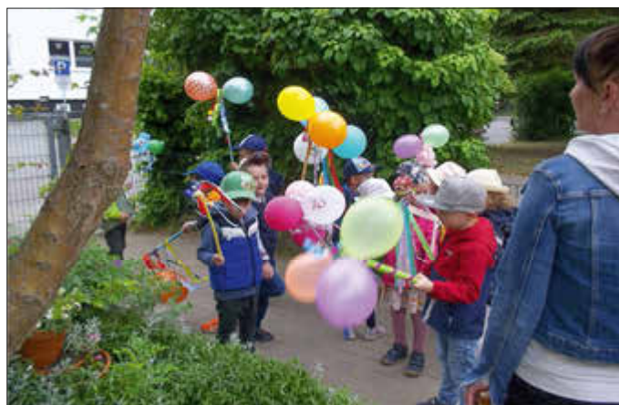
Antje Katke Kita Storchenkinder

Insgesamt war es ein sehr gelungenes Fest und jeder hat für sich einen schönen Moment mit nach Hause genommen. Wir freuen uns schon alle auf den nächsten Kindertag!