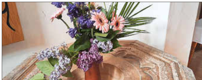
Blumen im Turmraum