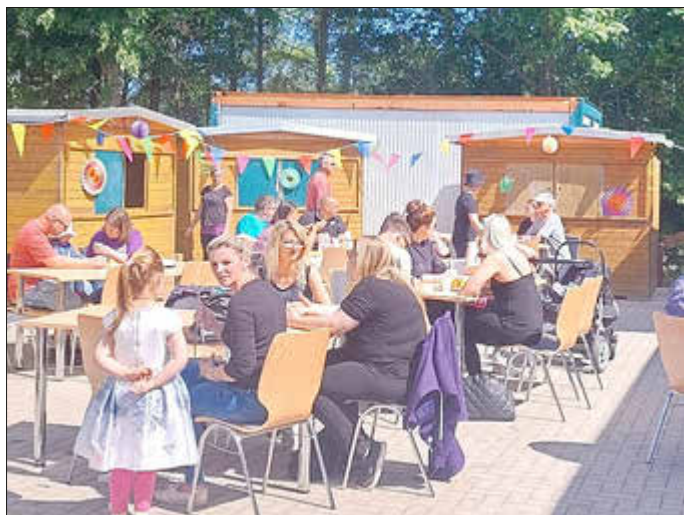
Astrid Meier Kulturverein Zarrendorf

Wir hoffen, es hat allen gut gefallen und bedanken uns hier nochmals ausdrücklich bei allen Beteiligten, die (wiederholt) mit wohl-schmeckenden und phantasievollen Kuchenspenden und/oder ihrer Tatkraft zum Gelingen dieses Zarrendorfer Events beigetragen haben.