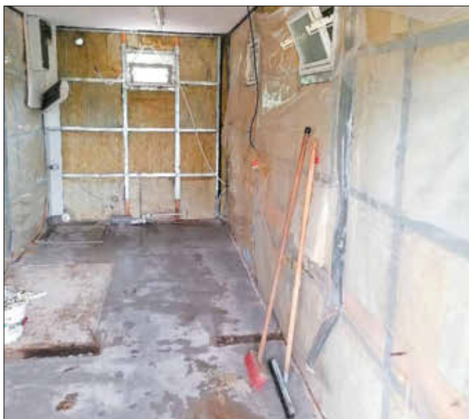
Entkernung des Sanitärcontainers