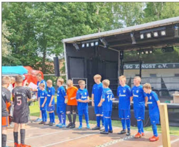
D-Jugend beim „Zingst Tag 2022“