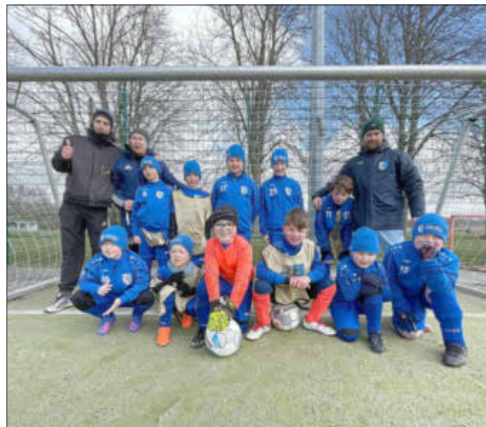
F-Jugend Testkick gegen den SV Barth 1950