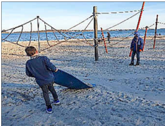
Toben am Strelasund