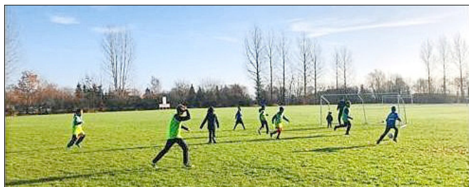
Erstes Training E-/D-Jugend 2022 im Außenbereich, da die Halle weiterhin gesperrt ist