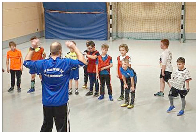
Erstes Training der Bambinis 2022

überweisen mit dem Betreff „99 Funken“. Wir werden dies dann zur Projektseite weiterleiten.