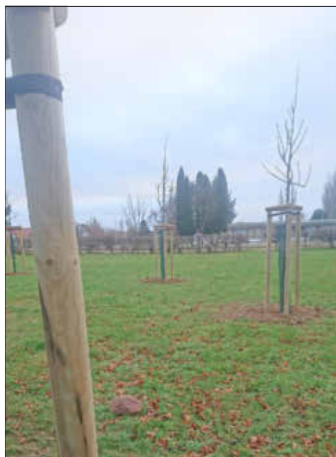
Baumpflanzung neuer Friedhof Steinhagen

Die größte Überraschung und Weihnachtsfreude bereiteten uns die Kinder der Christenlehre mit dem Krippenspiel als Film. Über alle Weihnachtstage wurde die Geschichte in der Kirche gezeigt. Zuschauer konnten mit Maria und Josef unsere Kirche, das Pfarrhaus und die Umgebung aus ganz neuen Blickwinkeln entdecken. Herzlichen Dank an alle Mitwirkenden vor und hinter der Kamera und an der Technik.