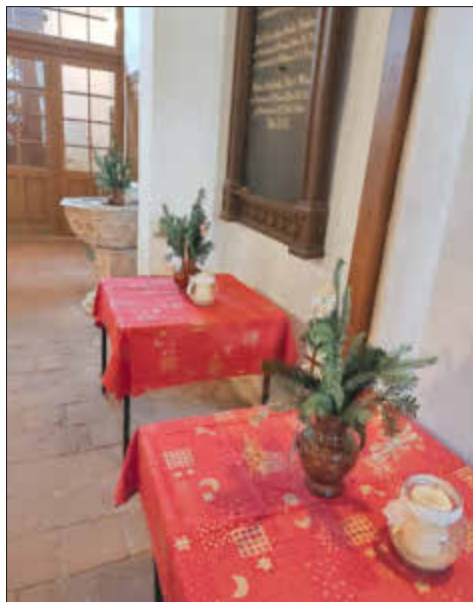
Weihnachten Dorfkirche Steinhagen