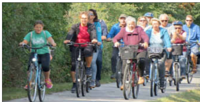
Unterwegs: Das Tempo war angemessen, der Krafteinsatz nicht zu intensiv, und das Zusammengehörigkeitsgefühl groß.