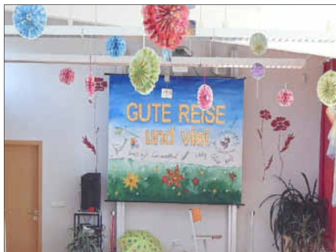
So empfangen wir unsere Schulanfänger.

Das lernen unsere kleinen Schulanfänger jetzt in der Grundschule Steinhagen. Voller Erwartung betreten am 18. September diesen Jahres 32 kleine ABC-Schützen unser Schulhaus. Sie wollten eingeschult werden. Bei einem bunten Programm der 2. Klassen begrüßten die Lehrer und die Direktoren alle Erstklässler in ihrem ersten Schuljahr und bereiteten ihnen eine schöne erste „Schulstunde“. Nach diesem ersten Eindruck im neu entdeckten Klassenzimmer, bekamen sie ihre Schultüten und gingen bei schönstem Wetter in einen aufregenden Nachmittag zu Hause.