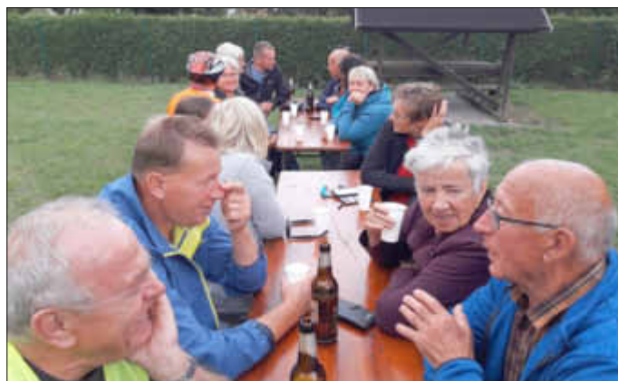
Für die Getränke sorgten unser Versorgungsteam und einzelne Teilnehmer - allen Spendern und Helfern ein großes Dankeschön