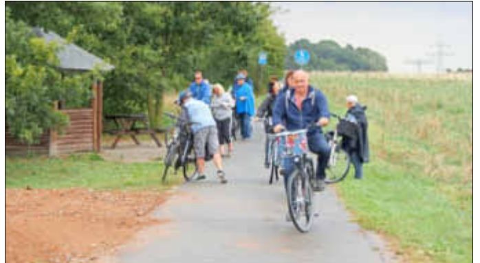
Zwischendurch mussten wir auch einen Regenschauer in Kauf nehmen.

Die Bestellungen für das Mittagessen wurden zügig aufgegeben und die Pause hat allen gut getan.