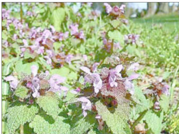
Rote Taubnesseln - wertvolle Blüten für Hummelköniginnen

Voraussetzung ist, die zur Aussaat vorbereitete Fläche vor und zur Blütezeit auf Fotos zu dokumentieren. Interessierte können sich ab sofort unter info@NABU-NVP.de melden. Auf Wunsch gibt es auch eine Beratung zur Ansaat und Pflege. Doch auch im Blumenbeet, Kräuter- oder Obstgarten ist in diesem Gartenjahr noch einiges für die Bienen möglich.