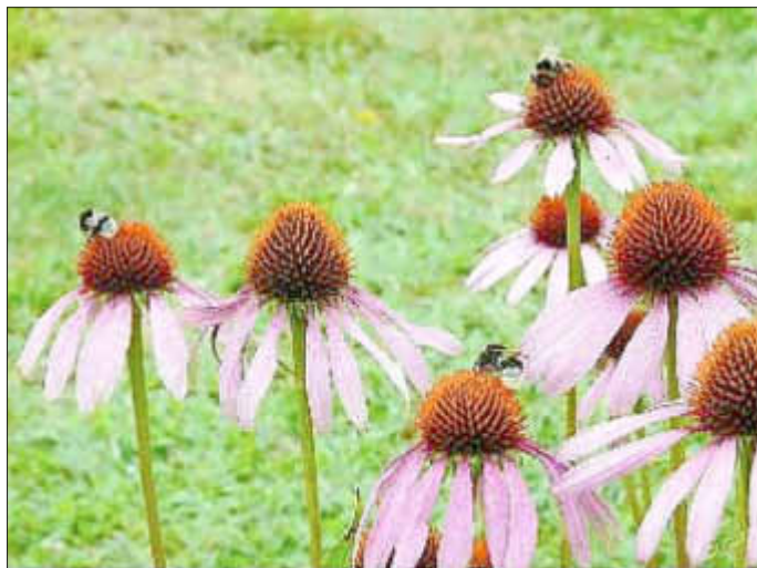
Purpurroter Sonnenhut mit Hummeln im August

mend, selbst in Dörfern mit Hausgärten. Dann leiden Hummeln schnell Hunger. Grund genug, um Biene Maja's wilden Schwestern einen gedeckten Tisch zu bereiten. Wer mindestens 100 Quadratmeter Gartenland für eine bunte Blühfläche zur Verfügung stellt und bis Mai einmalig den alten Bewuchs samt Wurzeln entfernt, dem bietet der NABU Nordvorpommern mit Unterstützung der Umweltlotterie BINGO! kostenlos eine Saatmischung für Bienen an.