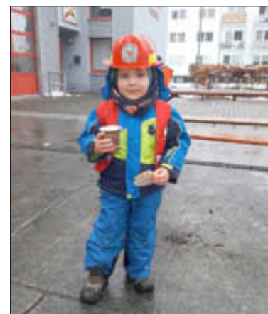
Feuerwehrmann sein? Oder lieber Ostereier suchen?

Die diesjährigen Wetterkapriolen dulden mich keine Farben! Sie halten alles in Grau-Weiß (mit einzelnen Farbparteln)