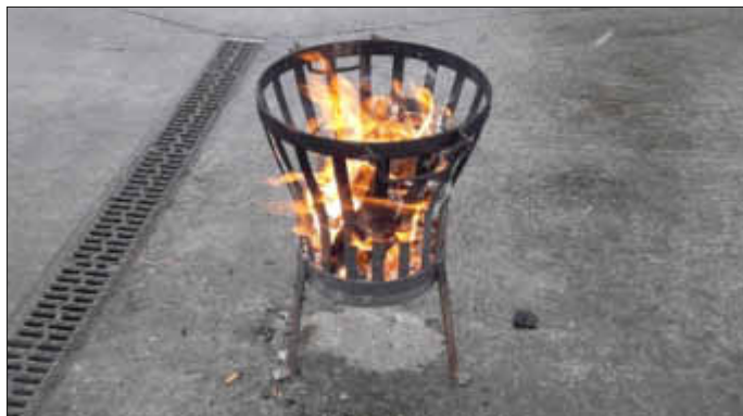
Großes oder kleines Osterfeuer?