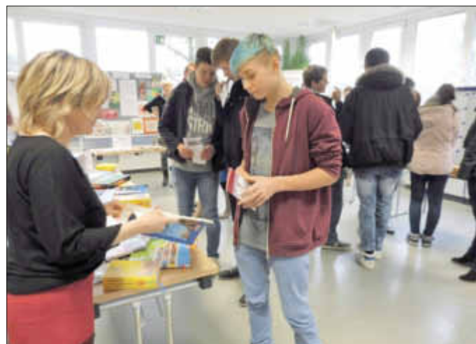
auch die allgemeinbildenden Unterrichtsfächer stellen sich auf der Bildungsmesse vor