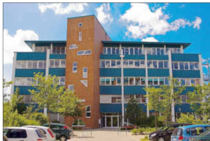
das Fachgymnasium befindet sich in der Lübecker Allee

Rückblick 2016 – Zahlreiche Schulabgänger informierten sich gemeinsam mit ihren Eltern über die Bildungsangebote am Fachgymnasium Stralsund