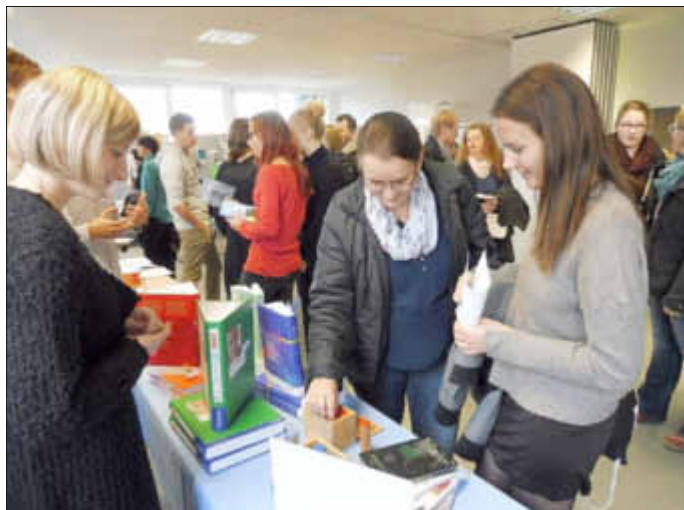
die Besucher können sich umfassend über die Lehrmittel informieren