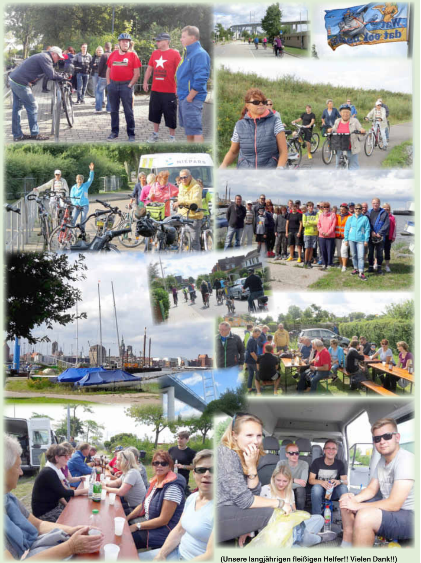
(Unsere langjährigen fleißigen Helfer!! Vielen Dank!!)

Wir haben uns gefreut, dass wieder so viel Radler teilgenommen haben und die Tour so gut vorbereitet war! Danke an die Organisatoren und alle Aktiven!