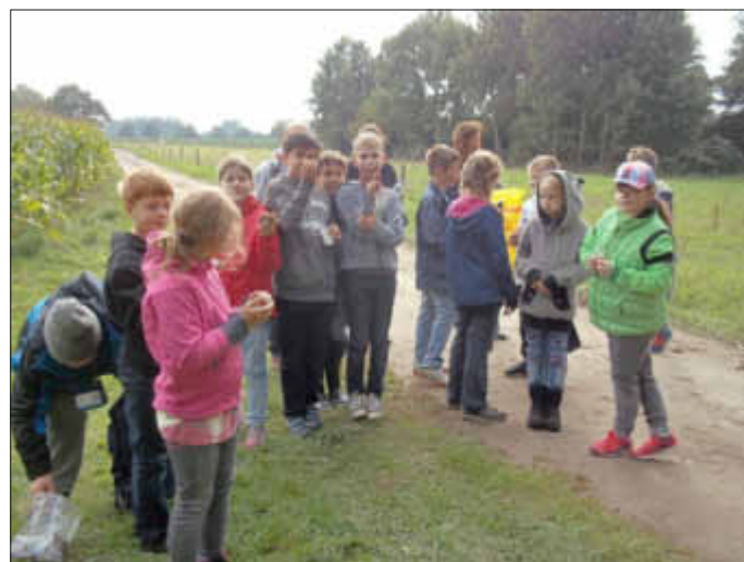
Klasse 4b GS-Steinhagen

Viel zu schnell verging die schöne Zeit im Wald und wir danken Herrn Ansorge aus dem Forstamt Schuenhagen wieder einmal ganz herzlich für die interessante Wanderung durch unseren Steinhäger Forst.