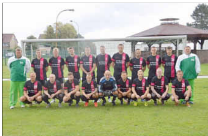
Mannschaftsphoto mit den neuen Poloshirts.