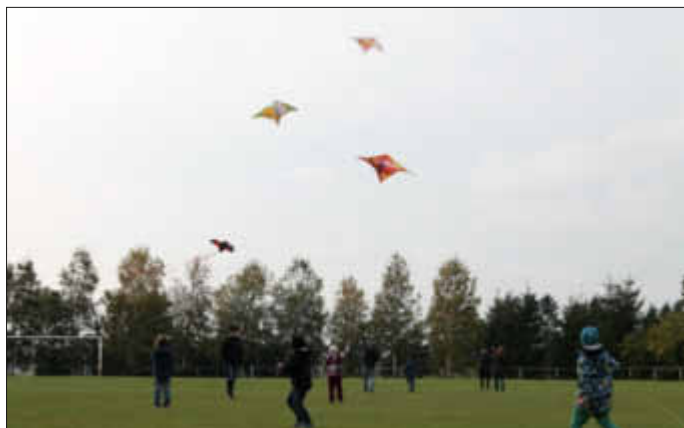
Eltern und Kinder der 1b