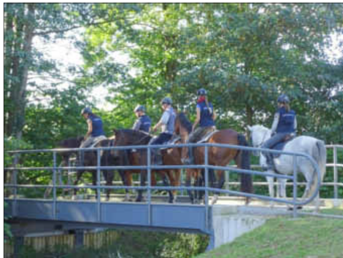
Reiter überqueren die Barthebrücke