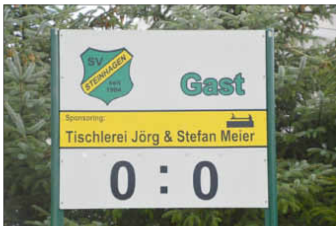
Neue Anzeigetafel für den SV Steinhausen gesponsert von der Firma Jörg und Stefan Meier.