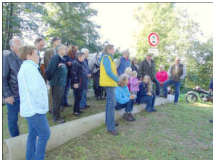
Gute Stimmung und interessierte Gäste, Foto von Silke Ritthaler.