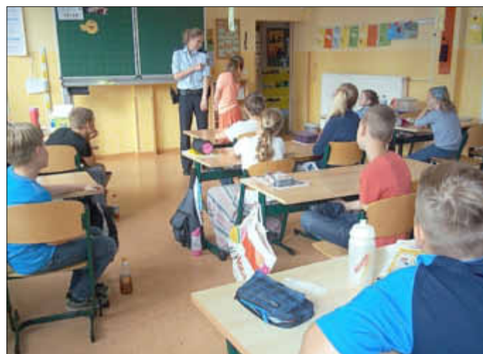
Kollegin der Bahnpolizei in der 4a.