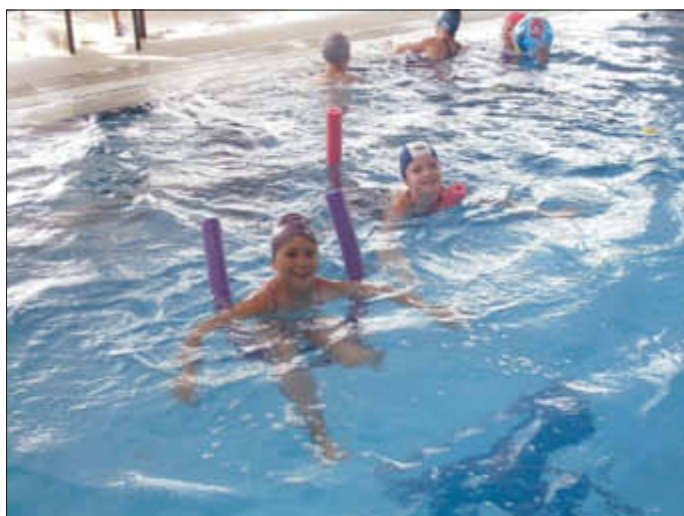
Kl. 3 kann endlich schwimmen.