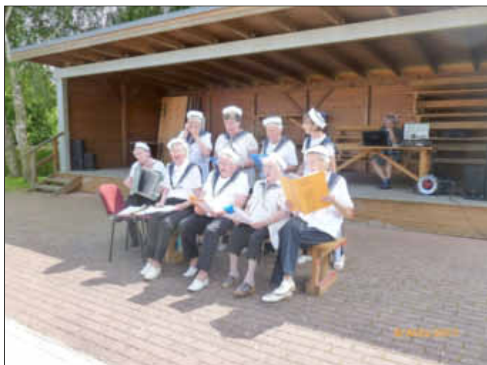
Es wird gesungen....