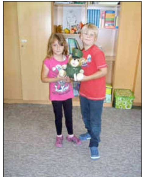
Zu unseren ersten Klassen kam außerdem noch der Polizeibär „Bulli“, der noch einmal allen klar machte, dass wir mit keinem Fremden mitgehen.