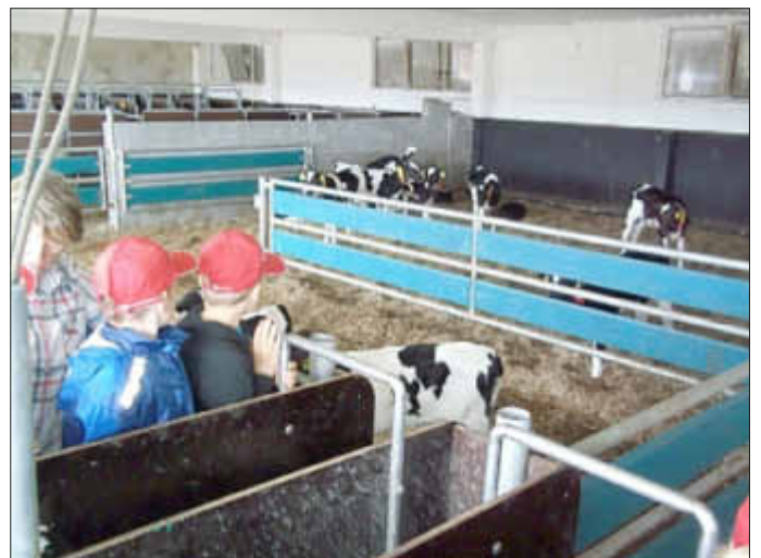
Bei den Kälbchen im Kuhstall.

Am Mittwoch war großer Ortserkundungstag. Die 1. Klasse besuchte z. B. einen unserer Großbauern und sie wanderten den Kuhstall in Steinhagen. Für eine 3. Klasse ging es in die Kreisstadt zur Stadtralley, die andere 3. Klasse festigte ihre Schwimmkenntnisse im Franzburger Freibad und die 4. bereiteten unseren Abschlusstag vor.