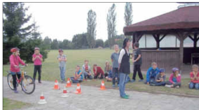
Die Verkehrswacht übte mit uns den Fahrradparcours.