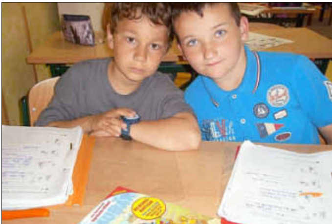
In der Theoriestunde ging es in Kl. 2 u. a. um Verkehrszeichen und in Kl. 3 um Fahrradregeln.