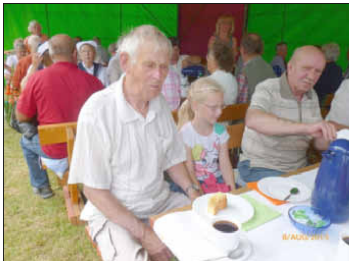
Kaffee getrunken, erzählt, sich amüsiert