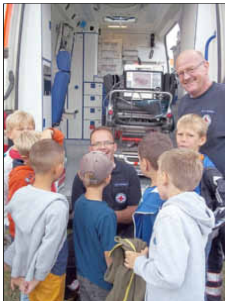
Unsere Rettungswacht aus Richtenberg.

Am Dienstag, 18. Juni fand an unserer Schule wieder der große Sicherheitstag statt. Auf unsere Projektpartner Partner war Verlass und so konnten wir wieder unsere Freiwillige Feuerwehr