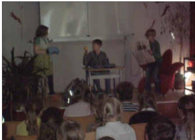
Sketch der 4b