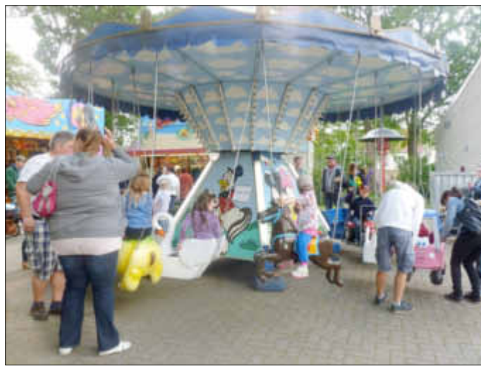
(Das war 2014)

Am 30. Mai feiern wir unser diesjähriges Kinder- und Parkfest. Ab 14:00 Uhr haben wir für unsere Kinder ein buntes Programm zusammengestellt, das bestimmt gut ankommt. Mit dabei ist wieder das Bungee-Springen, Reiten in verschiedenen Variationen, Schmink- und Bastelstände, Aktivitäten unseres Jugendclubs, Karussell und Schießbude und vieles andere mehr.