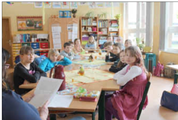
Klasse 4 lauscht dem Osterkrimi.