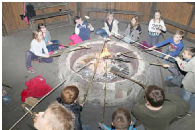
3b bäckt geduldig ihr Stockbrot.