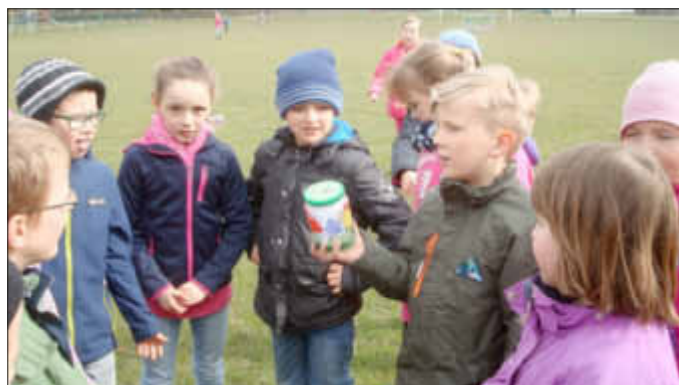
Klasse 2a findet eine Aufgabe vom Osterhasen.