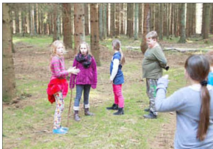
3b beim Spielen im Wald