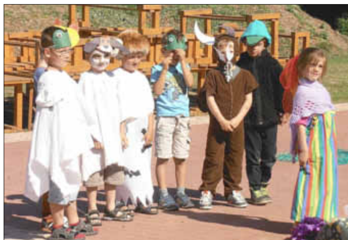
Letzter Auftritt der künftigen Erstklässler

Wie in jedem Jahr gab es wieder reichlich von den Omas, vielleicht auch von einigen Opas, gebackenen Kuchen. Leider war der Hunger doch nicht so groß, um von allen zu kosten. Für einige der Anwesenden war es der letzte Oma/Opa-Tag, denn ihre Enkel verlassen nun die Kita und wollen Schulkinder werden.