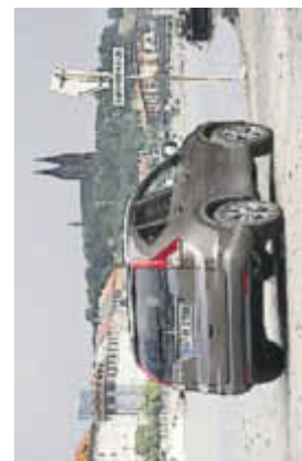
Der Honda CR-V bietet das größte Laderaumvolumen aller Kompakt-SUV.

Der erste Vertreter der neuen Motorengeneration ist der 1.6 i-DTEC. Er wird bereits im Civic eingesetzt. Bei der Entwicklung des frontgetriebenen Aggregats stand vor allem ein geringes Gewicht im Vordergrund. So besteht der kleine Diesel aus Aluminium, Bauteile