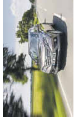
Der Honda CR-V 1.6 i-DTEC zählt zu den saubersten Vertretern seiner Klasse.

undsollide Verarbeitung. Das Raumangebot ist vorne wie hinten überaus ansehnlich und die straffen Sitze passen selbst ausgewachsenen Europäern. Gefallen findet auch das einfach zu bedienende Cockpit. In Sachen Variabilität überzeugt das japanische SUV mit cleveren Details. Mit