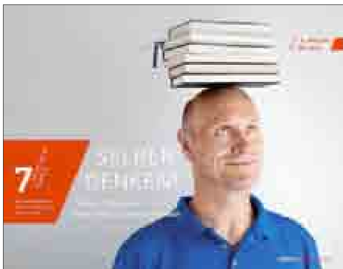
Die Fastenaktion der evangelischen Kirche

am Aschermittwoch, den 05.03., danach immer dienstags (11.03.;18.03.;25.03.; 01.04.; 08.04.+ 15.04.) 18.30 Uhr (12 Minuten) in der Nieparser Kirche