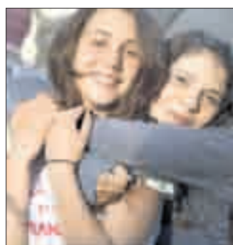
Jahreslosung 2014