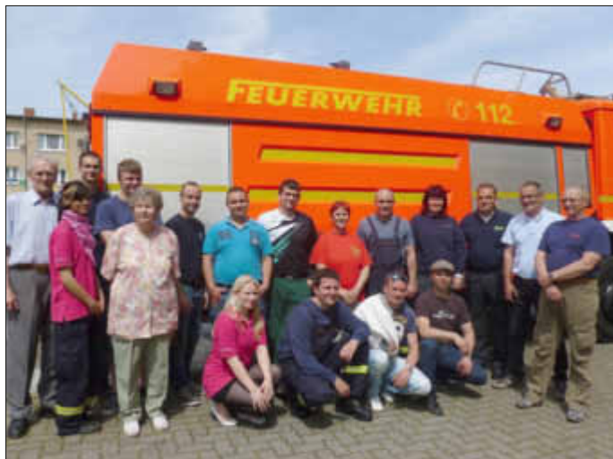
Ein neues Feuerwehrauto, mit 5.000 l Wasser und 500 l Schaum an Bord.

Alle Kameraden waren von der Technik und dem Know how begeistert.