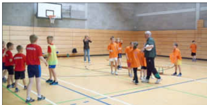
Altenpleen konnte Steinhagen vor der regulären Spielzeit besiegen.

Unsere Sieger, die „Kranich Grundschule“ Altenpleen, konnte mit einem Pokal nach Hause fahren, für alle teilnehmenden Mannschaften gab es eine Platzierungsurkunde.