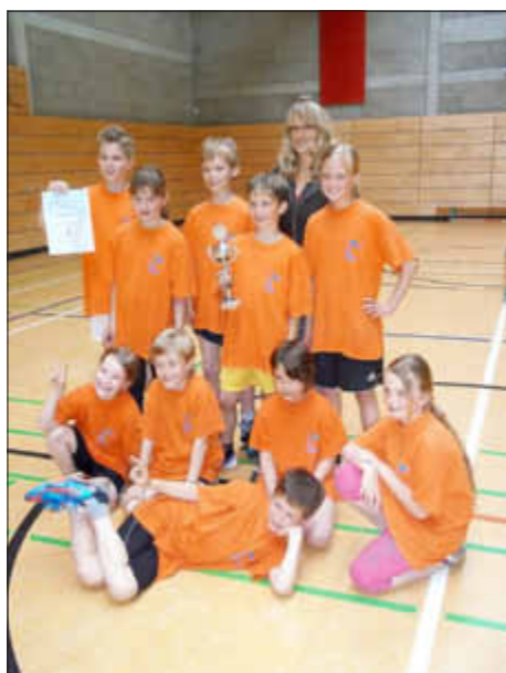
Unsere Sieger, Grundschule Altenpleen.