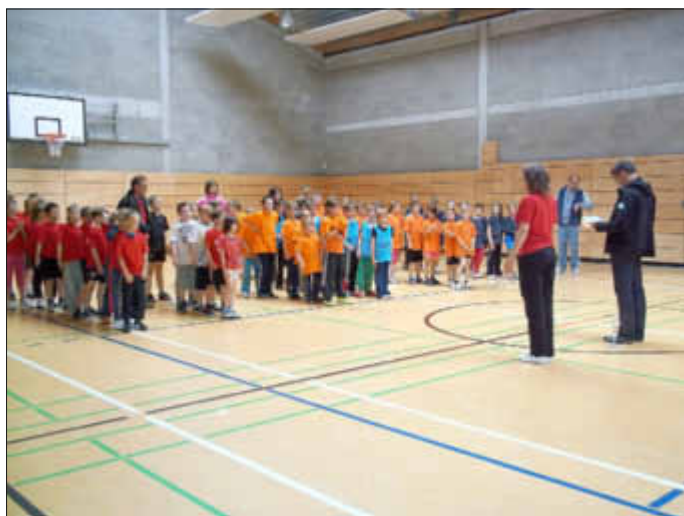
Alle Mannschaften bei der Siegerehrung.

Unseren Steinhäger Senioren möchten wir wieder besonders danken, da sie uns so die Treue halten und sich wieder rührend um die Verpflegung gekümmert haben und uns Schiedsrichter zur Verfügung stellten.