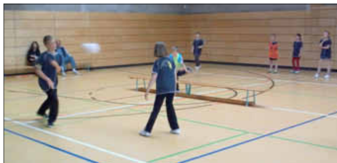
Spannender Kampf zwischen Niepars und Grammdorf.

Auch in diesem Schuljahr wollten wir für die Grundschulen die Tradition nicht abreißen lassen und haben für unsere Schüler den 2-Felderball-Wettkampf organisiert. Leider erhalten wir vom Kreis keinerlei Unterstützung mehr für unsere Sportwettkämpfe und so mussten die 6 Mannschaften (Altenpleen, Grammdorf, Velgast, Franzburg, Niepars, Steinhagen) mit Hilfe von Sponsoren und lieben Eltern den Transport allein absichern. Unsere Kinder waren wieder mit vollem Eifer dabei und so gab es spannende Spiele zu bestaunen. In diesem Jahr ist es Altenpleen gelungen, einige Gegner frühzeitig (vor Ende der Spielzeit) des Platzes zu verweisen und sie haben alle ihre Spiele gewonnen. Auch so manch hart umkämpfte Spiele, bei denen es immer hin und her ging und nur die Spielzeit am Ende über den Punktestand entschied, z. B. zwischen Velgast und Steinhagen oder Grammdorf und Niepars ließen die Stimmung in der Halle höher steigen.