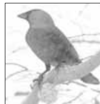
Sechs Dohlen wurden als Wintervögel gezählt.

2012 konnte bei den Zahlen im Vergleich der Zahlen vom Vorwinter erstmals ein Trend untersucht werden: Während Haussperling, Feldsperling, Kohlmeise, Blaumeise und Rotkehlchen zwischen 10 % und 50 % seltener gezählt wurden, waren Amseln nicht einmal halb so häufig wie im Vorjahr. Auch Buchfinken und Kleiber blieben bei der milden Witterung offenbar lieber in den Wäldern. Deutlich häufiger als im letzten Winter wurden in Nordvorpommern Rabenvögel wie die Saatkrähe, Elster und Nebelkrähe gezählt. Weitere Ergebnisse unter: www.stundederwintervoegel.de