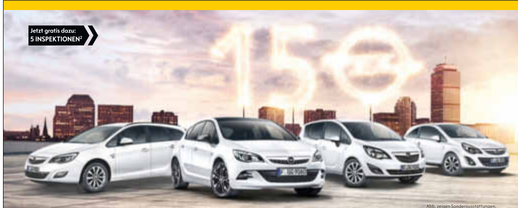
Abb. zeigen Sonderausstattungen.