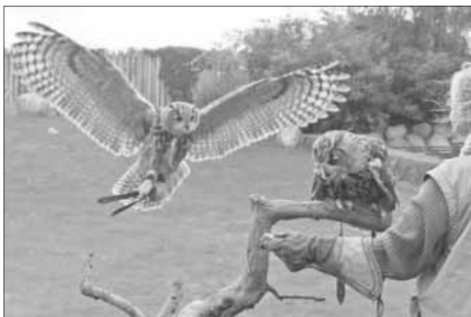
Melody wartet auf Symphony