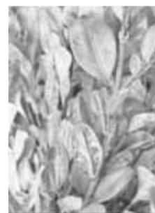
Cylindrocladium buxicola an Buchsbaum

Buchsbäume haben es zurzeit schwer: Die Landwirtschaftskammer Nordrhein-Westfalen beobachtet verbreitet ein Absterben von Buchsbaumtrieben. Die Ursache der Erkrankung ist der Pilz Cylindrocladium buxicola , der in diesem Frühjahr optimale Witterungsbedingungen vorfand. Die Sporen werden durch Wind verbreitet und dringen in die Triebe und Blätter ein. Vor allem nach einem Rückschnitt der Gehölze gibt es besonders viele Eintrittspforten an den Pflanzen. Die Folge sind braune Blattflecken und Strichelungen an den Trieben sowie das anschließende Absterben ganzer Triebe, Äste und Pflanzen.