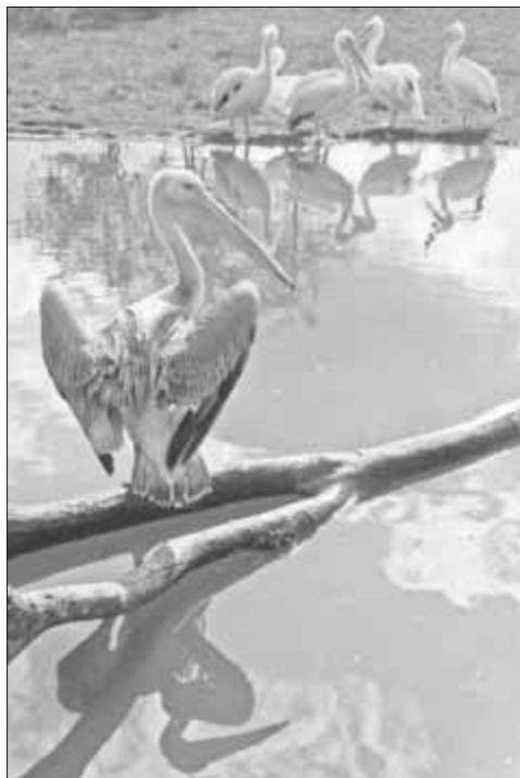
Die Jungtiere halten sich oft auf dem teich auf in Besuchernähe.