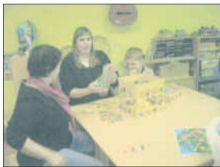
Spiele werden aufgebaut ...

Gruppenerzieherin der „Wassertreter“ aus dem Abenteuerland