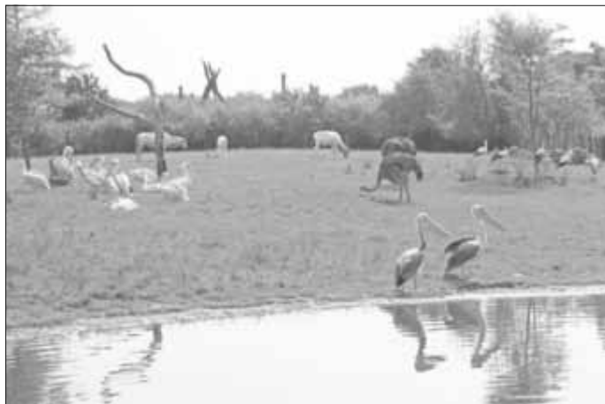
Mit ihren neun Monaten sind die Jungtiere schon größer als ihre Eltern.