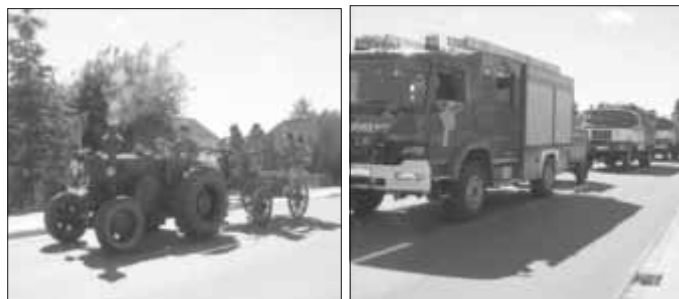
Bilder vom 75-jährigen Bestehen der Freiwilligen Feuerwehr