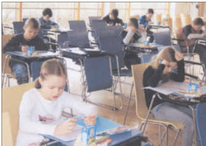
Angespannte Atmosphäre in der Aula