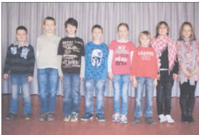
Unsere Mathematiker der 3. Klassen