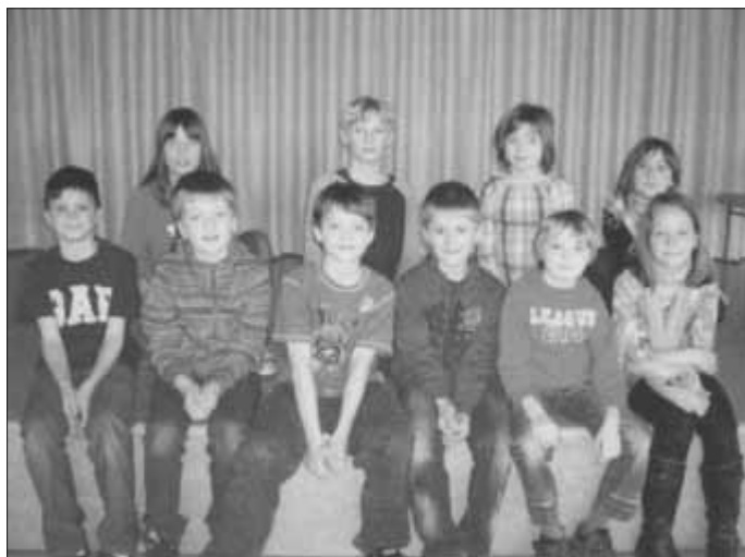
Unsere glücklichen Sieger und Platzierten