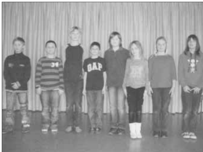
Die besten Mathematiker der 4. Klassen