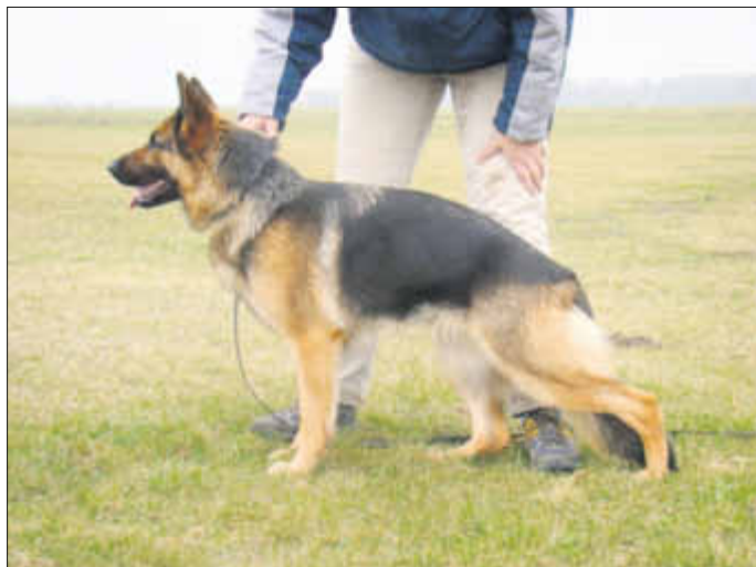
Standbild Deborah vom Krummenhäger See auf der Körung in Anklam