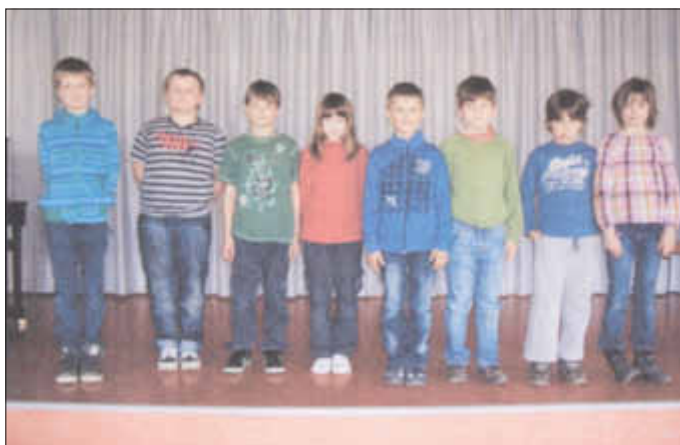
Die Teilnehmer der 2. Klasse